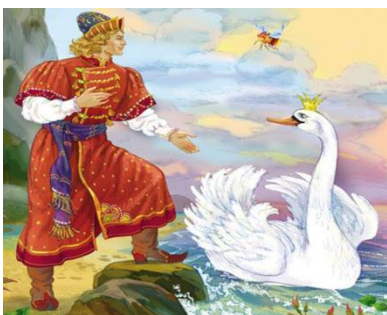
«Сказка о царе Салтане» А.С. Пушкина

6) В каком произведении художественной литературы говорится о валенках?