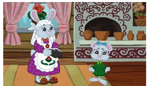
Сказка А.Алиша «Куян кызы»