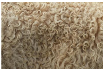
Из овечьей шерсти