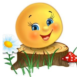
Народная русская сказка «Колобок»