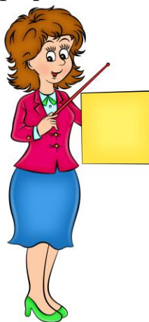
Музыкантам и учителям