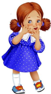
От имени девочки Вали