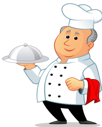
врачам и поварам