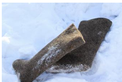
Потому что они валялись на снегу