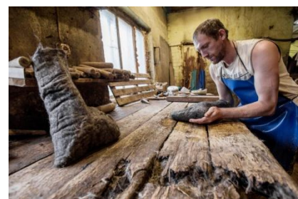
От слова «валять» шерсть как метода изготовления